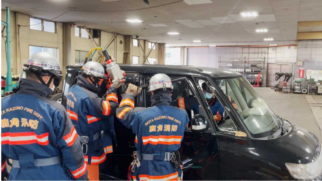
(油圧救助器具を使用してドアを開放している様子)

車両の単独事故により、車体の変形が激しくドアの開放不可。 運転手が車内に閉じ込められ、さらに脚が挟まれている状態。