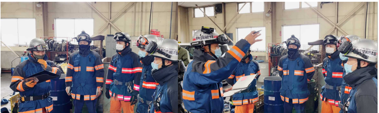
(各訓練担当者から助言及び評価を受けている様子)