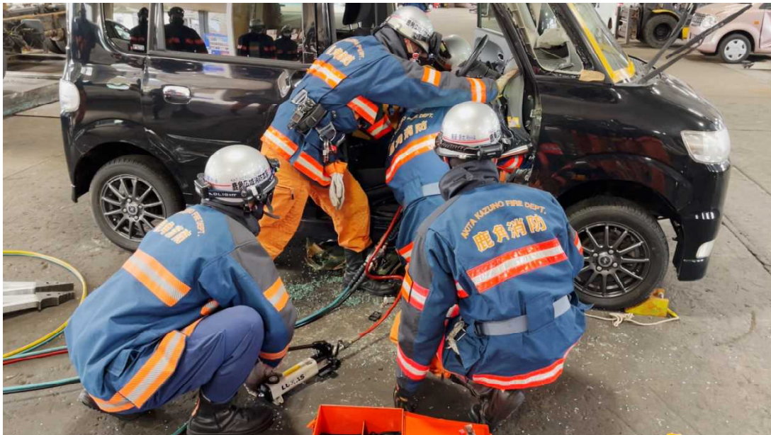
(要救助者の脚の挟まれを取り除いている様子)